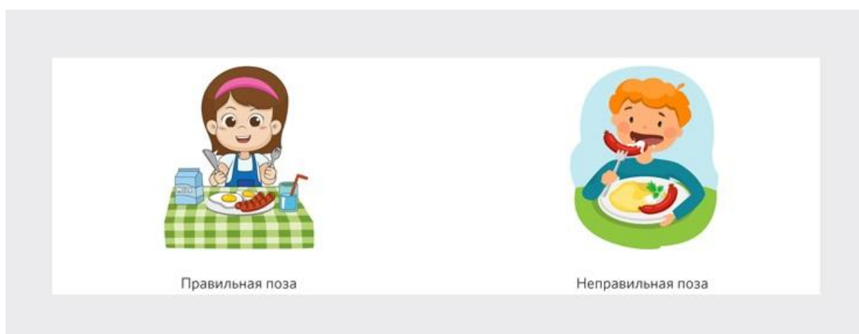
Рисунок 1. Как надо и не надо сидеть за столом

Нельзя сидеть с перекрещенными ногами, качаться на стуле, сидеть развалиясь, перегибаться через спину рядом сидящего, отодвигать стул всем весом своего тела, барабанить по столу пальцами, ставить на стол локти.